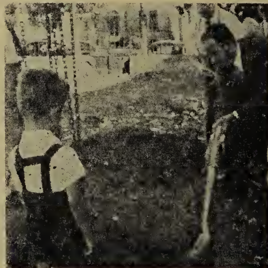
Aprendiendo del padre a colaborar

Han pasado cien años desde el día en que los 11 integrantes de la primera expedición Valdense pisaron tierra uruguaya. En estos últimos tiempos se ha notado una afluencia marcada de Valdenses, desde nuestras colonias hacia la Capital. Hoy suman más de doscientas familias. Son médicos, abogados, ingenieros, escribanos, farmacéuticos, profesores, maestros, comerciantes, estudiantes, empleados, etc. Este fenómeno ha planteado nuevos problemas a las autoridades competentes de nuestro pueblo, las de la Iglesia Valdense del Río de la Plata. En ningún momento y por ninguna razón los Valdenses han de perder su vigor moral y espiritual.